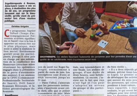
Le Pays, « Prévenir les maux de la vieillesse »